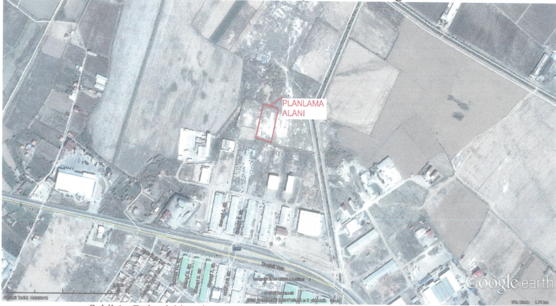
Şekil 1 : Bölgedeki yeri

Planlama alanı 1356 ada 1 parseli adaları Alaşehir İmar planında , L21-a-11-c paftasında yer almakta olup dikeyde 372 500 – 373 000 ile yatayda 4 248 500 – 4 249 000 koordinatları arasında yer almakta olup , imar planında Küçük Sanayi Alanı olarak görülmektedir.