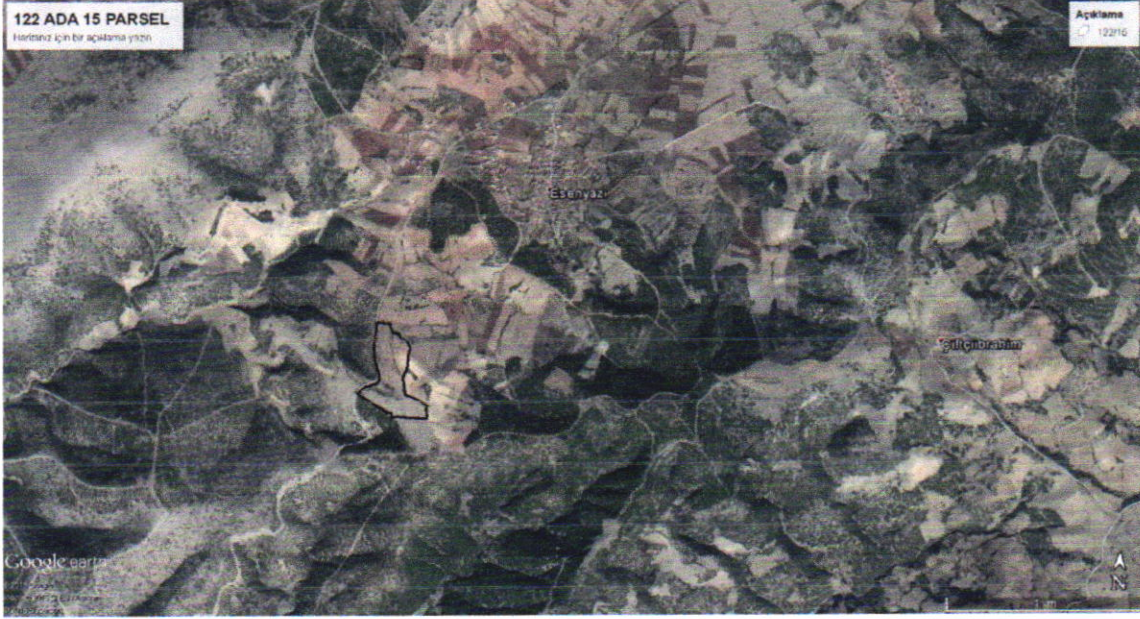
Şekil 1 : Bölgedeki yeri

Planlama alanı 122 ada 15 parsel Kula ilçe sınırları içerisinde K21-d-21-d paftasında yer almakta olup dikeyde 370 500– 372 000 ile yatayda 4 265 000 – 4 266 000 koordinatları arasında yer almakta olup , imar planında plansız alanda kalmaktadır.