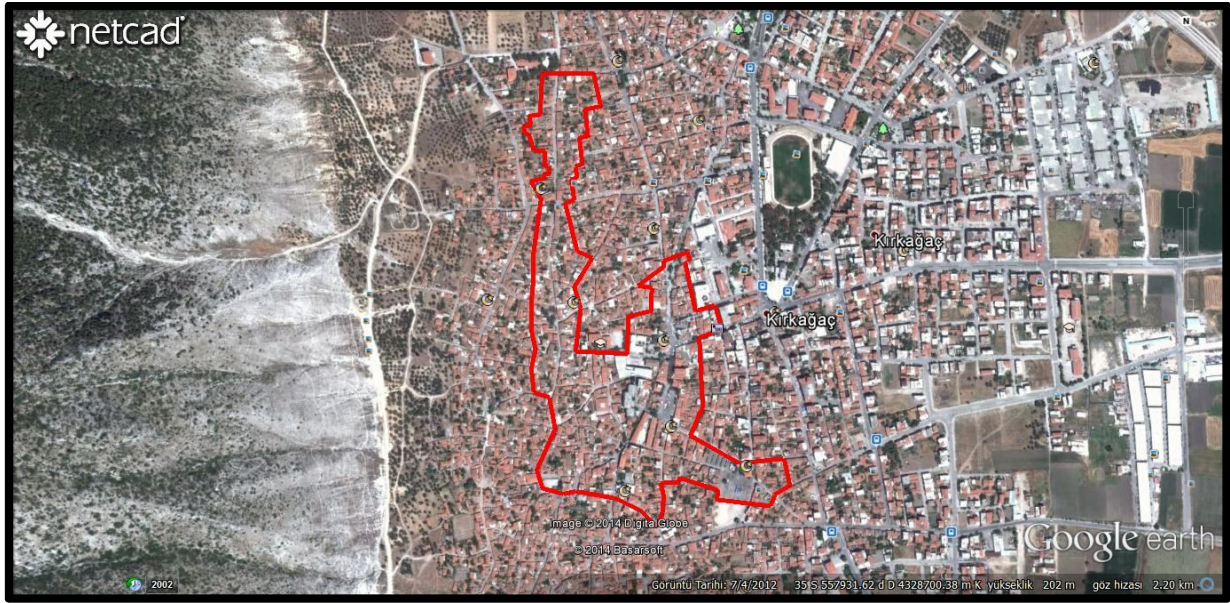
Plan sahasının bölge içindeki konumu

Planlama alanı, Kadriye mahallesinde bulunan Mehmet Güneklı İlköğretim okulundan başlayarak 6.sokak boyunca devam eden ve 6.sokağa bakan parselleri içine alarak, Güney kısımda Orta Camiye, Orta Camiden 23.sokak boyunca Hacı Mehmet Mahallesindeki Yeni Camii de içine alarak Cemal İçöz Caddesinin batı kısmından, Çiftehanlar Camii meydanına kadar uzanan ve bu meydanı da içine alarak 37.sokağın güneyinden devam ederek,38.sokaktan Menderes Caddesine kadar uzanır.44.sokak başlangıcındaki meydanı çevreleyen sınırdan 12 Eylül ilköğretim okulu ve Karaosmanoğlu Camii etrafını da içine alarak Boduroğlu mahallesini tamamında yer alır.