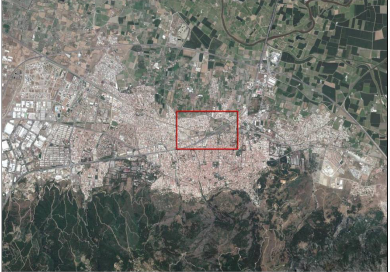
Harita 1: Planlama alanına ait uydu görüntüsü (uzak)

Plan değişikliği yapılan alan; Manisa İli Şehzadeler İlçesi, Peker Mahallesi ve Yarhasanlar sınırları içerisinde, Öğretmenevi önü ve çevresi, Mimar Sinan Bulvarı, 2323. Sok., 1713. Sok. ve Okul Caddesi'nin kesiştiği mevcut kavşak noktasında yer almaktadır. Mevcut durum itibarıyla kentin Sosyal, Eğitim, Resmi kurum, Yerel Yönetim Birimleri ve Ticari Alanlar bakımından çok yoğun olan bir kesiminde bulunmaktadır.