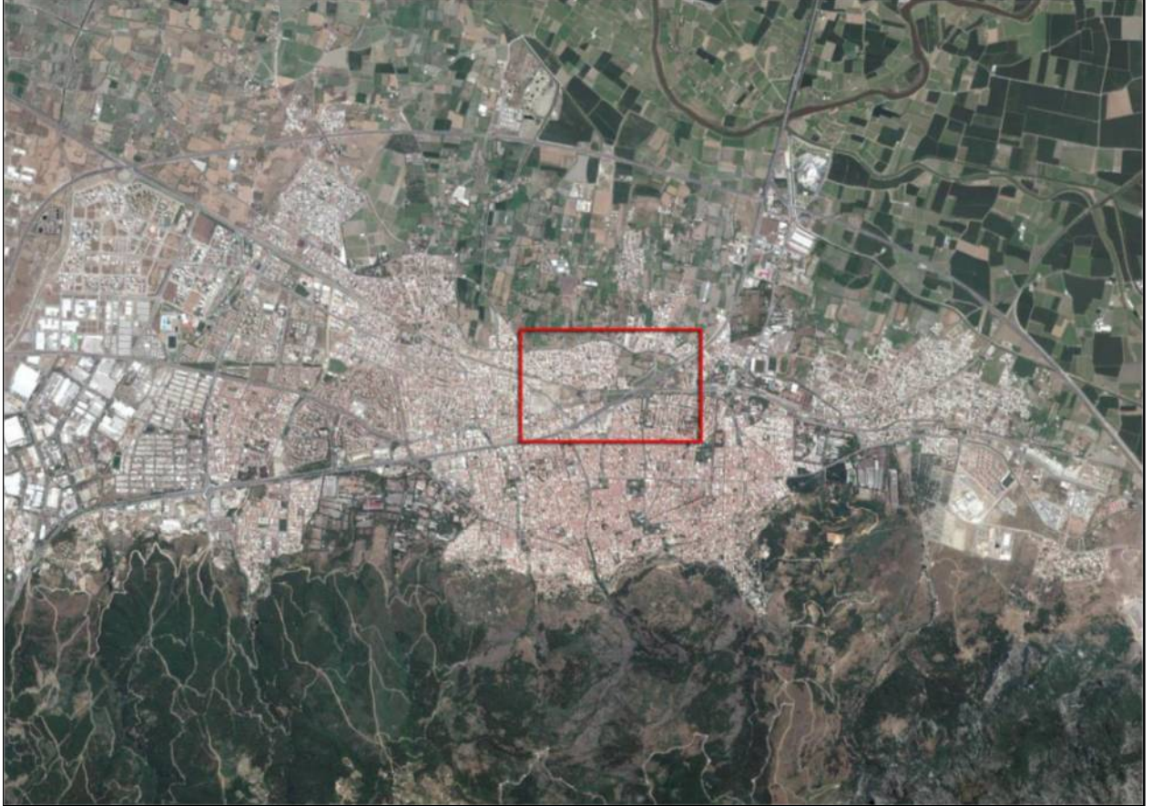
Harita 1: Planlama alanına ait uydu görüntüsü (uzak)

Plan değişikliği yapılan alan; Manisa İli Şehzadeler İlçesi, Peker Mahallesi ve Yarhasanlar sınırları içerisinde, Öğretmenevi önü ve çevresi, Mimar Sinan Bulvarı, 2323. Sok., 1713. Sok. ve Okul Caddesi'nin kesiştiği mevcut kavşak noktasında yer almaktadır. Mevcut durum itibarıyla kentin Sosyal, Eğitim, Resmi kurum, Yerel Yönetim Birimleri ve Ticari Alanlar bakımından çok yoğun olan bir kesiminde bulunmaktadır.