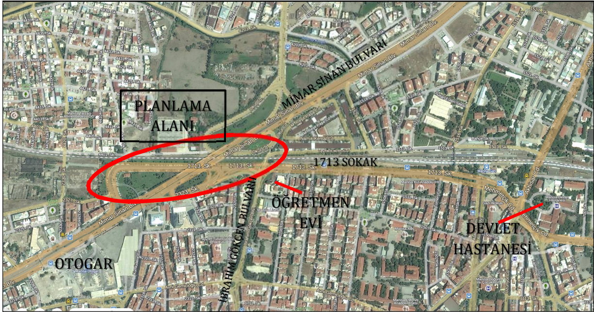
Harita 3: Planlama Alanının Ulaşım Ağı İçindeki Konumu

Söz konusu planlama alanı Mimar Sinan Bulvarı ile 1713 Sokak kesişme noktasındadır. Kentin içinde kalmış olan bu kavşak, hem İzmir yönünde ulaşım bağlantıları sağlamakta hem de kentin kuzeyinden geçen ve şehri by-pass eden Balıkesir-İzmir (D385) Devlet yolu ile bağlantılı olarak hizmet vermektedir.