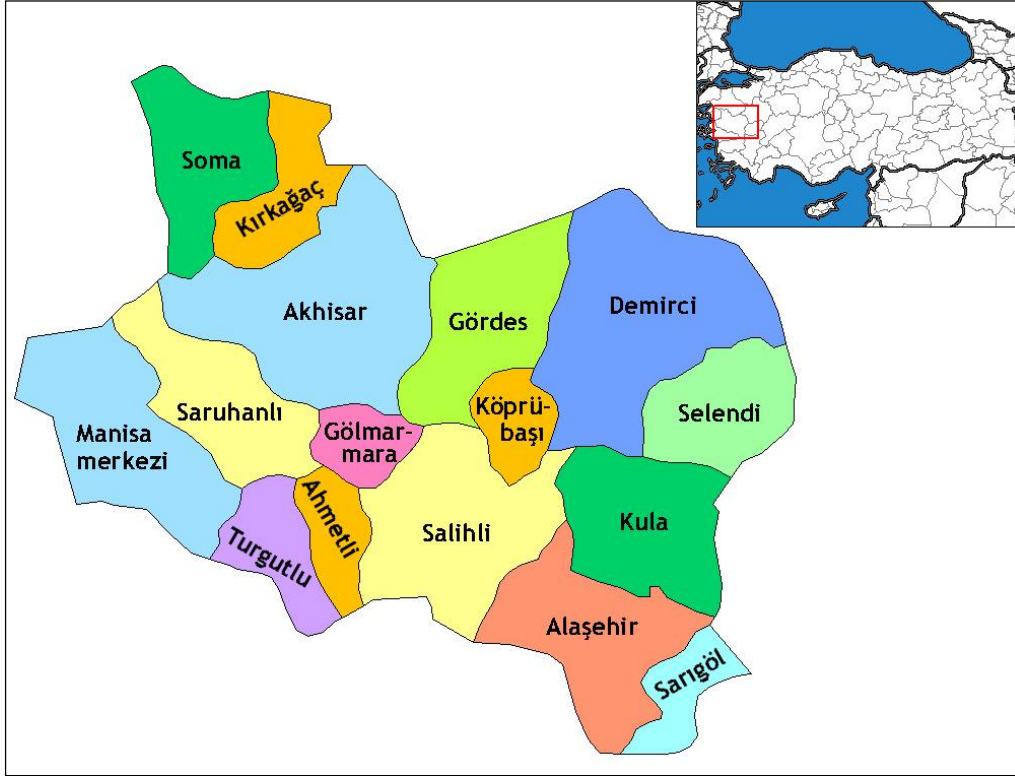
Harita 4: Kentin İdari Bölünüşü

Manisa, Türkiye'nin bir ili ve en kalabalık on dördüncü şehri. 2015 TÜİK verilerine göre 1.380.366 kişi Manisa'da yaşamaktadır. Anadolu Yarımadası'nın batısında, Ege Bölgesi'nin ortasında yer alır. Doğudan Uşak ve Kütahya, Güneyden Aydın ve Denizli, Kuzeyden Balıkesir ve Batıdan İzmir ile komşudur. 27°08' ve 29°05' doğu boylamları ile 38°04' ve 39°58' kuzey enlemleri arasında yer alır. 17 ilçesi bulunur. Toplam nüfus bakımından İzmir'den sonra Ege Bölgesinin 2. büyük ilidir. 2012 yılında çıkarılan 6360 sayılı kanun ile büyükşehir olmuştur. "Şehzadeler Şehri" olarak da adlandırılan yerleşim, mesir macunu, sultaniye üzümü ve Manisa Tarzanı ile tanınır. Antik çağda "Magnesia", Roma İmparatorluğu döneminde tam ismiyle "Magnesia ad Sipylum" olarak anılmıştır. Şehir, Spil Dağının eteklerinde kurulmuştur. Gediz Nehrinin büyük bir bölümü il sınırları içerisinde geçmektedir.