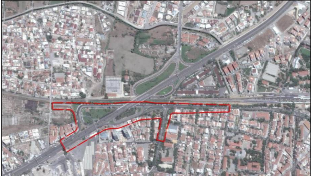
Harita 2: Planlama alanına ait uydu görüntüsü (yakın)