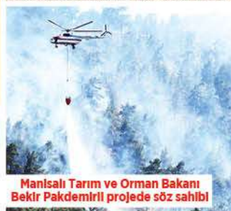
Manisalı Tarım ve Orman Bakanı Bekir Pakdemirli projede söz sahibi

Yatırımların konuşulduğu koordinasyon kurulu toplantısında Manisa'nın çevre kirliliğine dikkat çeken Vali Ahmet Deniz, kentte bir günü temizlik günü ilan edeceklerini açıkladı