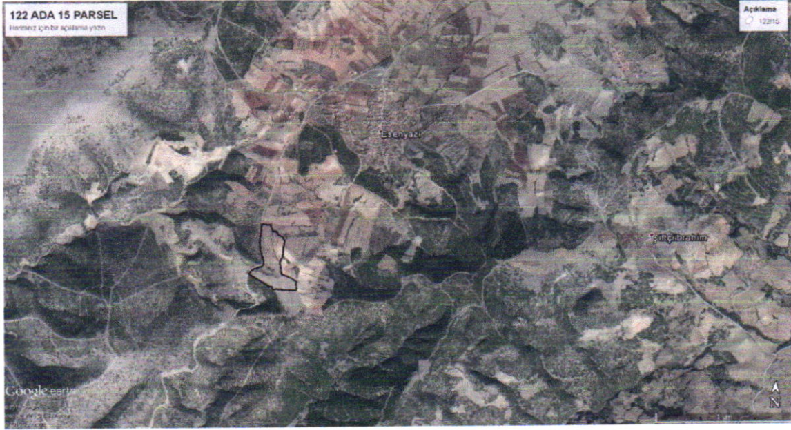
Şekil 1 : Bölgedeki yeri

Planlama alanı 122 ada 15 parsel Kula ilçe sınırları içerisinde K21-d-21-d paftasında yer almakta olup dikeyde 370 500– 372 000 ile yatayda 4 265 000 – 4 266 000 koordinatları arasında yer almakta olup , imar planında plansız alanda kalmaktadır.