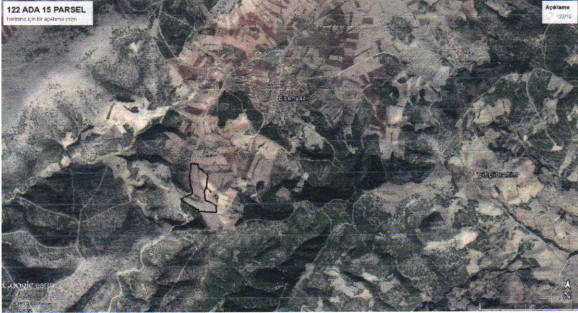
Şekil 1 : Bölgedeki yeri

Planlama alanı 122 ada 15 parsel Kula ilçe sınırları içerisinde K21-d-21-d paftasında yer almakta olup dikeyde 370 500– 372 000 ile yatayda 4 265 000 – 4 266 000 koordinatları arasında yer almakta olup , imar planında plansız alanda kalmaktadır.