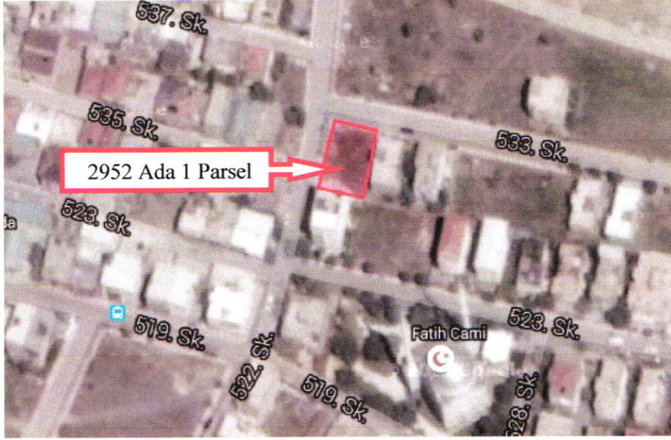
Planlama Alanı ve Yakın Çevresi