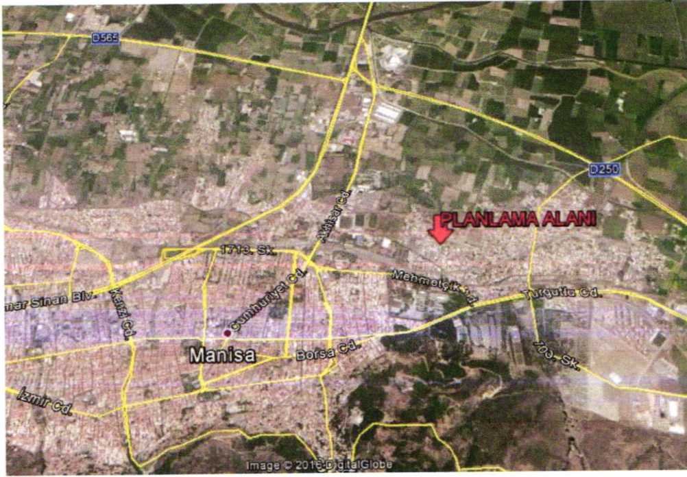
Planlama Alanının Kent İçindeki Konumu

Plan değişikliğine konu olan taşınmaz Manisa İli, Şehzadeler İlçesi, Şehitler Mahallesi sınırları içerisinde bulunmaktadır. Kent merkezinin kuzeydoğusunda bulunan taşınmazın yer aldığı yapı adasının güneyinde 523.Sokak, doğusunda 536.Sokak, batısında 522.Sokak ve kuzeyinde 533.Sokak bulunmaktadır.