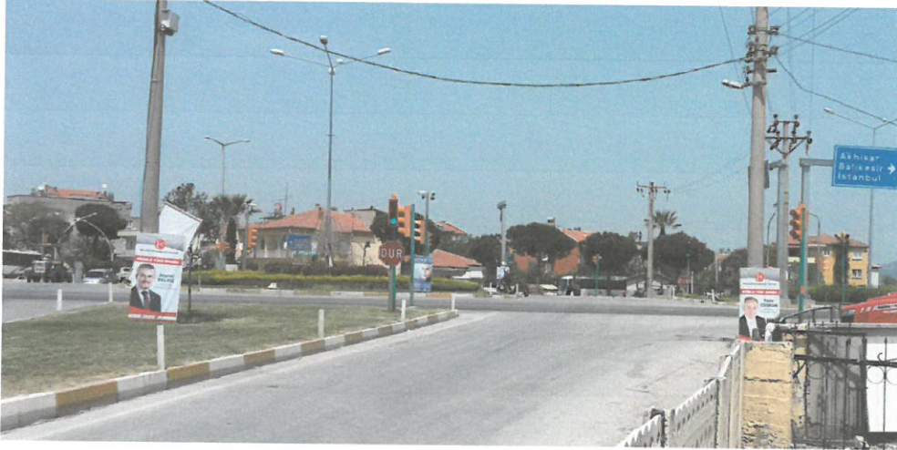
Şekil 3. Saruhanlı Kavşağı Mevcut Durumu

Plan tadilat teklifinin amacı geometrik düzenlemesi yapılan Saruhanlı İlçesinde D565 Karayolu üstten geçecek şekilde katlı kavşak tasarımı yapılmış, altında kalan hemzemin kavşak ise dört kollu Modern Dönel Kavşak olarak düzenlenmiştir.