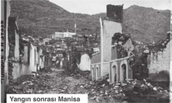
Yangın sonrası Manisa

rargâh su bayları ile birlikte Ma- nisa'ya girerken camilere, devlet dairelerine bayrak çekiliyordu. Gazi Mustafa Kemal Paşa, "Mil- letlerin esareti üzerine kurulmuş müesseseler, her zaman yıkıl- maya mahkûmdur." derken bir ta- rihi hakikati dile getiriyordu. İlelebed yaşamak isteyen bir mil- let, tarihini de yaşatmak zorunda- dır. Bizler yokluklar içinde, destanlar yazan bir milletin ço- cuklarıyız. Memleketlerinin düş- man çizmesi altında vatanseverler, yer yer bölgesel kurtuluş hareketlerine girişmiş- lerdir. Daha kongreler yapıldı, Milli Mücadelenin programı belli olmadan, Batı Anadolu işgale karşı çıkmıştır. Kahraman Türk ordusu Manisa'yı 8 Eylül 1922 günü Yunan zulmünden kurtardı. Biz Manisa ve Türk milleti ola- rak tekrar aynı duruma düşme- mek için Atatürk'ü çok iyi okuyup anlamamız lazım. Başko- mutan Mustafa Kemal Atatürk'ün eserlerine ve Cumhuriyet'i ne sahip çıkmalıyız. Bize yazılan nutuk ve gençliğe hitabeden ders- ler almamız ki tekrar aynı du- rumları yaşamayalım" dedi.