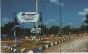
hakem kaleleri hazırlandı, seyir tavakelleri monte edildi.

Belediye ekibi, Güreş Festivali'nin yapılaçığı Ortaköy Mesire Alanı'nda çevre düzenlemesi gerçekleştirildi. Alanında yatakların Güreş Festivali'nin daha iyi izlenmesi amacıyla tribün ve