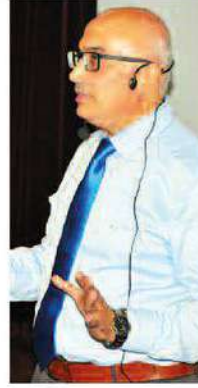
ŞİFAYA KAVUŞMA KONFORLARINI ARTTIRMAKTIR

Demirel Kültür Merkezi'nde gerçekleştirilen toplantıda Rektör Ataç, katılımcıların sorun ve taleplerinin yanı sıra çözüm önerilerini dinledi. Ortak akla dikkat çeken Ataç, toplantı sırasında katılımcılara boş kağıt dağıtarak, oluşturulacak yeni üst yönetim ve komisyonlarda görmek istedikleri isimleri yazmalarını istedi.