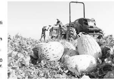
Yüzde 60'ı tarladan kesildikten sonra hemen

muza yurt dışına daha yoğun bir şekilde ihracat olanağını değerlendireceğiz. Çünkü ihracatımız yok denecek kadar az. Bu da bizim iç piyasaya yönelmemize neden oluyor. İç piyasada ise istediğimiz fiyat aralığını yakalayamıyoruz. Yani bunun ihracatını artırsak çiftçimizin kazancı biraz daha artacak. İl Tarım ve Orman Müdürlüğüyle ihracat konusunda çalışmamız var." AA