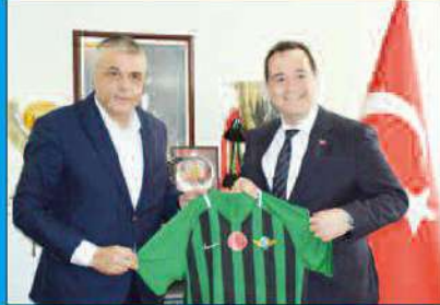
TÜRKİYE Futbol Adamları Derneği (TÜRFAD) Akhisar Şubesi, 1970 Akigolar Derneği, Yeşil-