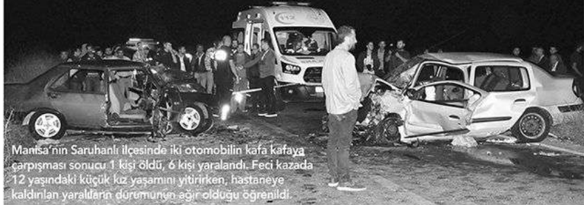
Manisa'nın Saruhanlı ilçesinde iki otomobilin kafa kafaya çarpışması sonucu 1 kişi öldü, 6 kişi yaralandı. Feci kazada 12 yaşındaki küçük kız yaşamını yitiren, hastaneye kaldırılan yaralıların durumunun ağır olduğu öğrenildi.

MANISA'NIN Saruhanlı ilçesinde iki otomobilin kafa kafaya çarpışması sonucu 1 kişi öldü, 6 kişi yaralandı. Feci kazada 12 yaşındaki küçük kız yaşamını yitiren, hastaneye kaldırılan yaralıların durumunun ağır olduğu öğrenildi.