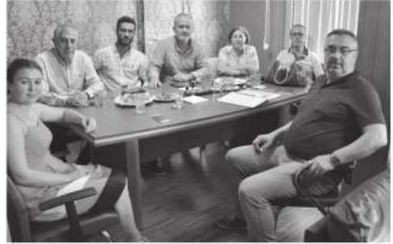
Müteahhidin kendisine düşen tüm bağımsız bölümlerin satışını yapabilmesi için arsa sahiplerinin

cek olan yapılarda tüketicilere bağımsız bölüm satış yapılrken bitirme oranına göre satış yapılması şartının getirildi. Buna göre; Riskli yapılarda veya riskli alanlarda yapılmakta olan inşaatlardan bağımsız bölüm satın almak isteyen tüketiciye müteahhitler (kendi bağımsız bölümlerine düşen bağımsız bölümleri) inşaatın ilerleme seviyesine göre idarenden alacakları iznle (belediyeler veya il özel idaresi) satış yapabilecek.