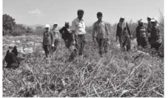
sıcaklığı oluyor. Bize başvurana hastalarımız arasında en riskli

Güneşin yoğun olarak hissedildiği bölgede tarım işçilerinin riskli meslek gruplarının başında yer aldığına dikkat çeken Eskiizmir, dudak kanserinden korunma yöntemlerini anlattı. Eskiizmir, şöyle devam etti: "Normal şartlarda eğer kaçınılabiliyorsa, en temel davranış güneşten kaçınmak olması gerekiyor. Özellikle güneşin aktif olduğu 10.00 ile saat 16.00 saatleri arasında mümkünse uzak kalmaları daha akılcı olacaktır. Ama tarım işçileri ve bazı çeşitli meslek grupları meslek gereği maalesef güneşten kaçamaz ve karşı karşıyadır. Bu kişilerin korunma yönünden davranışlar sergilemesi en azından kanser gelişiminin riskini azaltma anlamında önemli. Geniş şapkalı koruyucu etki olabilir. Güneş kremleri ve dudak nemlendiricileri ile korunma en azından kanser gelişiminin azalması için önemli bir faktördür. Onun dışında güneşe çıkmama gibi bir şansları varsa güneşten uzak durmaları en doğru hareket olacaktır. Dudak kanserlerine bizim bölgemiz özelinde bakarsak, Türkiye ortalamasının üzerinde. Mayıs ayından Eylül ayına kadar şiddetli bir güneş