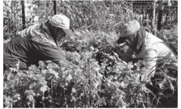
meslek grubu olarak tarım işçileri yer alıyor." ■ İHA