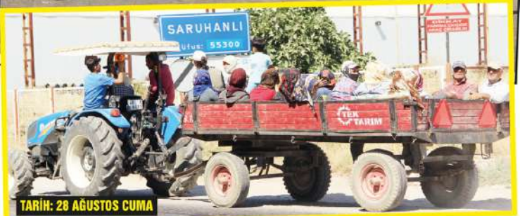
TARİH: 28 AĞUSTOS CUMA

Manisa'da Perşembe günü sabah erken saatlerde, kapalı panelvan ile tarım işçisi taşıyan traktörün çarpışması sonucu 3 kişinin öldüğü 10 kişinin de yaralandığı kazanın acısı tazeliğini korurken, tarım işçilerinin açık kasa araç ve traktörler üzerinde tarla ve bağlara tehlikeli yolculuğu sürüyor.