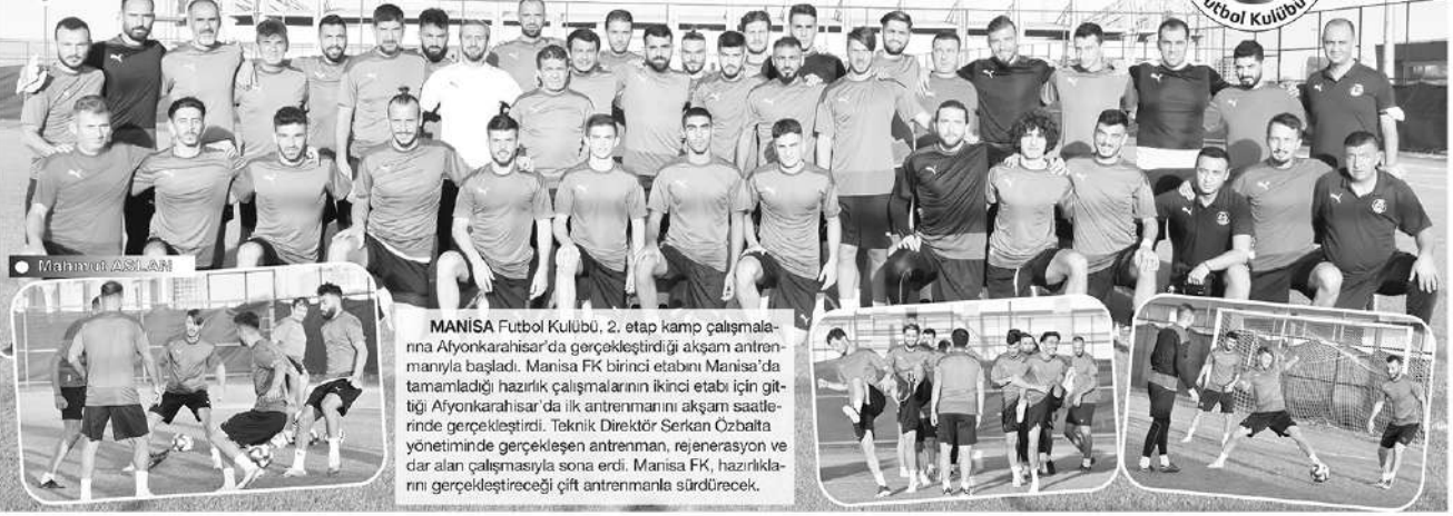
Manisa Futbol Kulübü