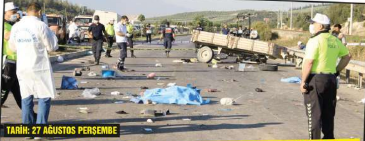
TARİH: 27 AĞUSTOS PERŞEMBE