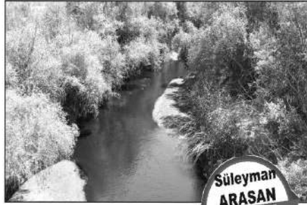
Geziz nehri ile Alaşehir çayını kirlilettiği dedi.