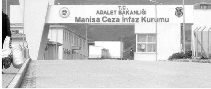
Manisa Cumhuriyet Başsavcılığı'nın talimatları doğrultusunda yürütülen FETÖ/PDY

Manisa'da FETÖ/PDY soruşturması kapsamında 17 Mayıs tarihinde gözaltına alınan 46 kişiden adliyeye sevk edilen 21 kişiden 14'ü tutuklandı. Soruşturma kapsamında ayrıca dün sabah erken saatlerde 8 kişi ise gözaltına alındı.