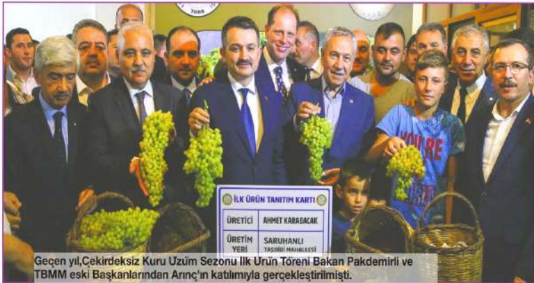
Geçen yıl, Çekirdeksiz Kuru Üzüm Sezonu İlk Ürün Töreni Bakan Pakdemirli ve TBMM eski Başkanlarından Arınc'ın katılımıyla gerçekleştirildi.

"Manisa'da 2019 Haziran ayı raporlarına göre 222 bin 528 ton üzüm tescil edildi. Manisa Ticaret Borsamızda ise tescil edilen ürün ise 64 bin 161 tondur. 20 Temmuz tarihli son ihracat rakamlarına baktığımızda 230 bin 903 ton ile ülkemize 467 milyon 492 bin dolara üzerinde bir ihracat döviz girdisi sağladık. Eğer kaliteli üzüm olmazsa kaliteli ürün ihracat edemeyiz. Kaliteli üzüm bizim yurt dışındaki elimizi güçlendirir. Bununla beraber bu kaliteli üzümü satmak var. Almanya'da ve Fransa'da açılan fuarlarda stant açarak Türk üzümün dünyaya tanıtıyorlar. Biz bu konuda çok iyiyiz. Ben ne kadarda borsa başkanı olsam eğer ki en kaliteli üzümü satıyorsek en pahalı üzümü de biz satmamız gerekir" • 7'de