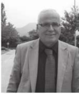
"GİZEMLİ KÖREZ MAĞARASI KEŞFEDİLMİYİ BEKLİYOR"