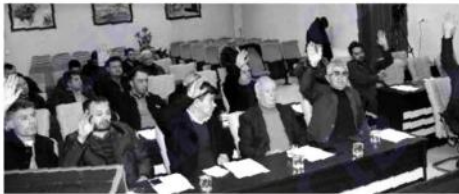
KULA Belediye Meclisi Aralık ayı Olağan Meclis Toplantısı, Kula Belediye Başkanı Hüseyin Tosun başkanlığında yapıldı. Başkan Tosun yaptığı açılış

konuşmasında, 2018 yılında Kula'nın bekası için büyük projeleri hayata geçirdiklerini ifade eden Kula Belediye Başkanı Hüseyin Tosun, "İlk olarak de-