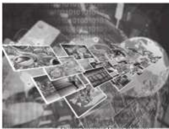
Dijital Yayınlar Daire Başkanlığı

En büyük takipçimiz: En büyük takipçimizin Cenab-ı Allah olduğunun şuru içinde takipçi sayısını artırmaya çalışmak yerine Rabbimizin rızası ve hoşnutluğuna kazanmak doğru ve gerçekçi bir yaklaşımdır. (Bkz. Ekmelel Geçer, Medya ve İletişim Psikolojisi, DİB yay., Ankara, 2020)