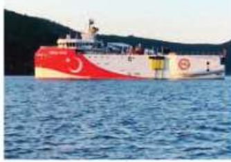
Enerji ve Tabii Kaynaklar Bakanı Fatih Dönmez, "MTA Oruç Reis Sismik Araştırma Gemimiz, Akdeniz'deki yeni görevi

in Antalya'dan demir alarak, çalışma yapacağı alana ulaştı. Rast gele" dedi.