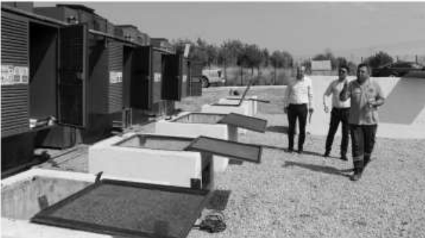
Manisa Su ve Kanalizasyon İdaresi (MASKİ) Genel Müdürü

lülüğü daha temiz bir Gediz ve Bakırçay havzası için çalışmalarına