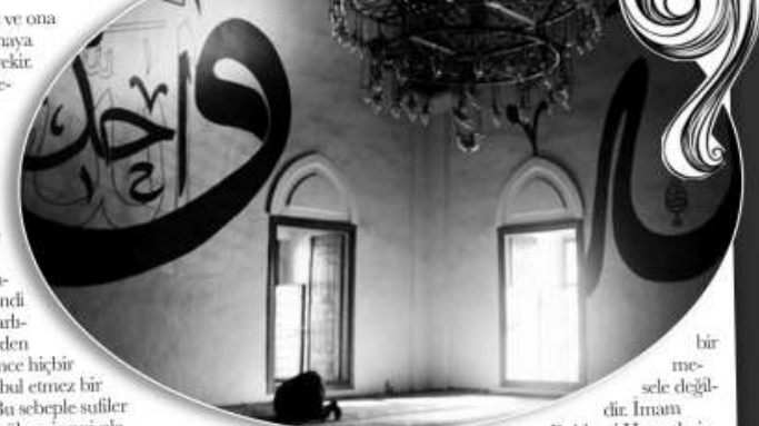
bir mesele değildir. İman

Dövene elsiz gerek, Sövene dilsiz gerek, Sen derviş olmasın, Derviş gönüllüs gerek Derya gönüllü olmak bazılarının zannettiği gibi sadece insanın şahsi nezaketini ilgilendiren