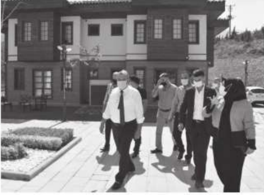
Müstakil Sanayici ve İşadamları Birliği (MÜSİAD) Manisa Şubesi yönetimi, Yunus Emre Belediye Başkanı