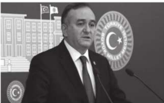
MHP Grup Başkanvekili Manisa Milletvekili Erkan Akçay,