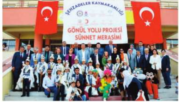
Kültür ve Turizm Müdürlüğü, Gençlik ve Spor İl Müdürlüğü, hayırseverler katkı sağladı. ■ ÖZCAN ÖZKAN

Şehzadeler Kaymakamlığı, Şehzadeler Kaymakamlığı, İlçe Milli Eğitim Müdürlüğü, İlçe Sağlık Müdürlüğü, İlçe Müftülüğü, Şehzadeler Sosyal Yardımlaşma ve Dayanışma Derneği, Türk Kızılay, Aile Çalışma ve Sosyal Hizmetler İl Müdürlüğü,