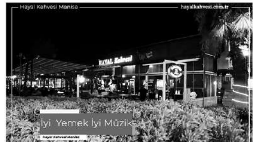
Hayal Kahvesi Manisa