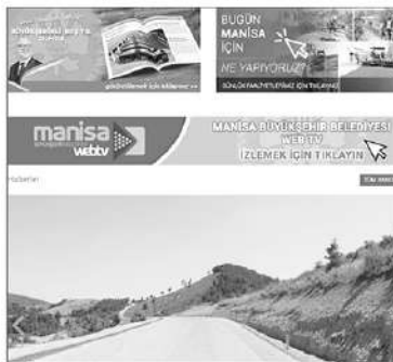
MANİSA Büyükşehir Belediyesi Bilgi İşlem Dairesi Başkanlığı, Büyükşehir Belediyesi resmi internet

sitesi olan www.manisa.bel.tr adresinde yapılacak teknik altyapı ve güncelleme çalışması nedeniyle bugün saat 17.00 itibarıyla web sitesinin ve bazı çevrimiçi uygulamaların geçici olarak hizmet veremeyeceğini duyurdu. Manisa Büyükşehir Belediyesi'nin resmi internet sitesi www.manisa.bel.tr 10 Ağustos Pazartesi günü (dün) saat 17.00 itibarıyla teknik altyapı ve güncelleme çalışmaları nedeniyle bir süre hizmet veremeye-