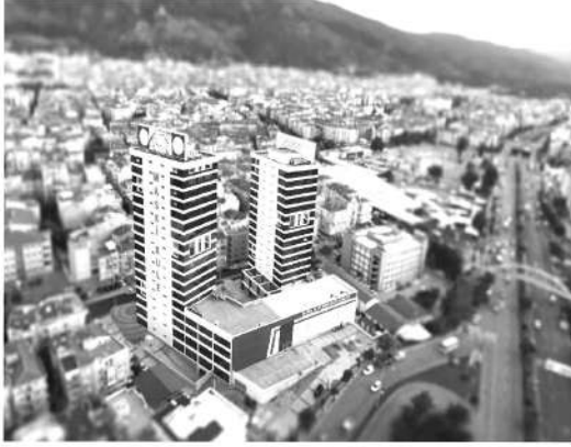
Manisa Su ve Kanalizasyon İdaresi (MASKİ) Genel Müdür-

lüğü, Soma ilçesine bağlı Cenkyeri Mahallesi sakinlerinin susuz