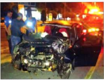
Manisa'da kontrolden çıkan otomobilin ağaca çarpması sonucu, 1 kişi hayatını kaybederken 3 kişi ağır yaralandı