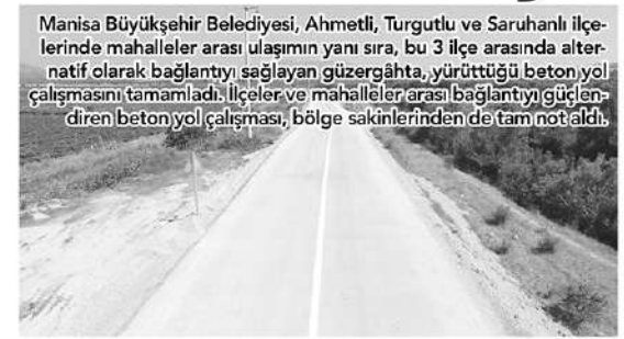
Manisa Büyükşehir Belediyesi, Ahmetli, Turgutlu ve Saruhanlı ilçelerinde mahalleler arası ulaşımını yanı sıra, bu 3 ilçe arasında alternatif olarak bağlantıyı sağlayan güzergâhta, yürüttüğü beton yol çalışmasını tamamladı. İlçeler ve mahalleler arası bağlantıyı güçlendiren beton yol çalışması, bölge sakinlerinden de tam not aldı.

çeleri arasında bağlantıyı sağlayan 40 kilometrelik güzergâhta beton yol çalışması gerçekleştirdik. Mevcut güzergâhta gerçekleştirdiğimiz çalışmayla, hem ilçeler arası bağlantıyı güçlendirdik, hem de tarım arazilerinin yoğun olarak bulunduğu bu güzergâhta mahalleler arası ulaşımı konfora kavuşturduk. Çalışmanın bölge sakinlerimize hayırlı olmasını diliyorum. Güle güle kullanınlar" dedi. Haber merkezi