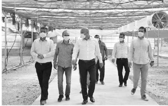
Manisa Büyükşehir Belediye Başkanımız Cengiz Ergün'ün talimatları doğrultusunda çalışmalarımızı sürdürüleceği" diye konuştu. Haber Merkezi

mamladık. Yerleşmeye devam ediyoruz. Burada mevcut bulunan bitkilerimiz için 10 bin metrekare replikaj alanı, ağaç fidanlarımızı yetiştirmek için 10 bin metrekare telli terbiye sistemimiz ve 4 bin metrekare kapalı sera alanımız vardır. İlk yıl için planladığımız mevsimlik çiçeklerin tohum ile üretimi ve bazı çalı grubu bitkilerinin (lavanta, sarıpapatya, gold telfan, ihal kartopu gibi) çelik ile üretimini gerçekleştireceğiz. Süs bitkileri üretimini de kendi imkanlarımız ile gerçekleştireceğiz için kamu kaynaklarını daha etkin ve verimli kullanmış olacağız.