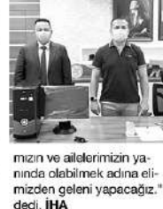
mızın ve ailelerimizin yanında olabilmeleri adına elimizden geleni yapacağız." dedi. İHA

mızın başarısına yansıtacaktır. Elbette ki suyu istiyoruz; bir önce pandemi döneminde kurtulalım, çocuklarımız sınıflarda sıralarında bu dersleri işleyebilirsin. Gerçek eğitim yüz yüze eğitimidir ama bu olağanüstü koşullar geçene kadar da çocukların