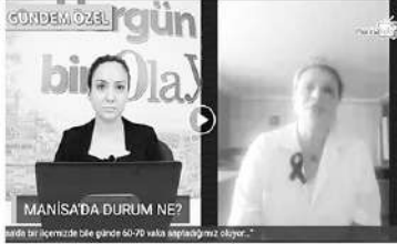
Bütün bir ilimizde bile günde 60-70 vaka saptadığımız oluyor."

Hem Manisa'da hem de ülke genelinde yatak doluluk oranlarının yüksek olduğunu işaret eden Temiz, şöyle konuştu: "Mevcut kapasitemizle