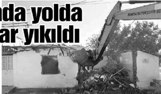
Kamulaştırılması yapılan bu binalar, Yol Yapım ve Onarım Dairesi Başkanlığımızca koordineli olarak, 14.09.2020 tarihinde yıkımı gerçekleştirildi. Uzlaşma sağlanmayan bina malikleriyle ilgili kamulaştırma davaları açılmış olup, süreç devam etmektedir. Mahkeme süreci bitmesine müteakip, kalan binalar boşaltılıp yıkımı gerçekleştirilecektir" dedi.