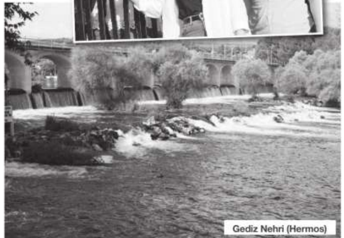
Gediz Nehri (Hermos)