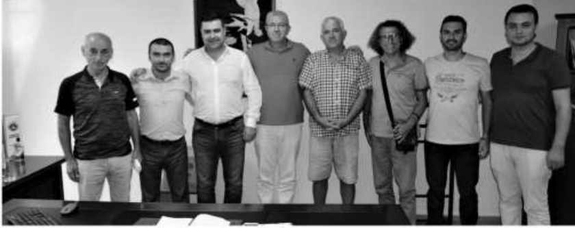
Turgutlu Belediyesi tarafından yeni kurulan Turgutlu Belediyesi