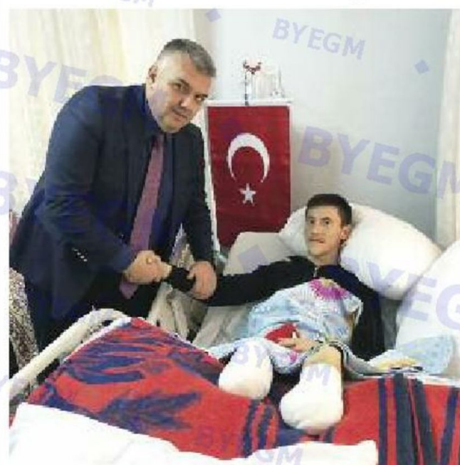
Manisa Büyükşehir Belediye Meclisi Engelliler ve Kadın